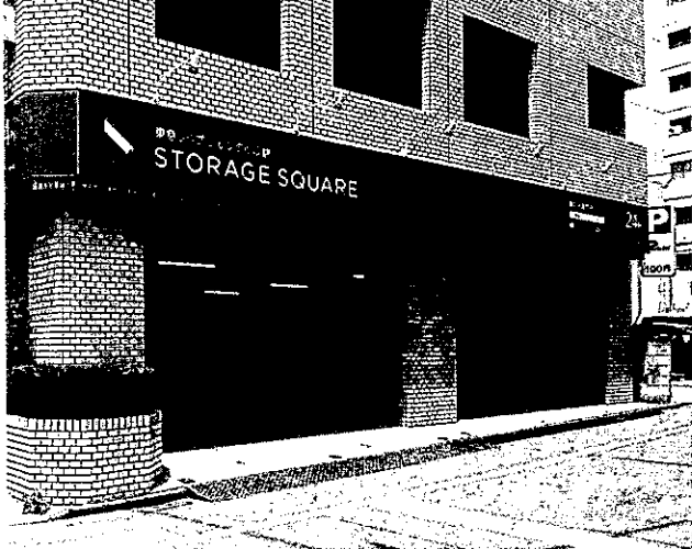
東急リパブルは、東京・半蔵門で新規事業として参入した