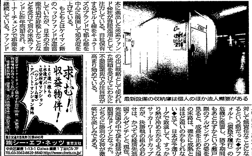
最新設備の収納庫は個人のほかに法人需要がある